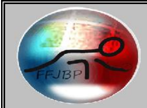
Tableau final FFJBP CSF